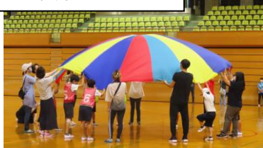
たけのこさんの合同スポーツ大会