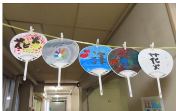
たけのこさんの風鈴とうちわ